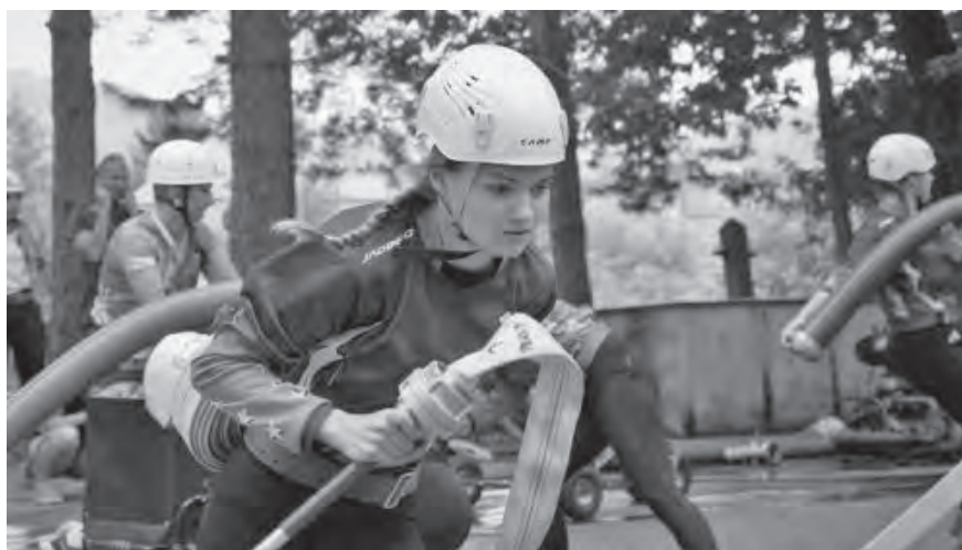
...a hurá na to!