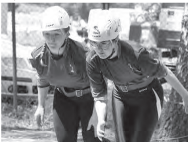
Soustředění před startem...