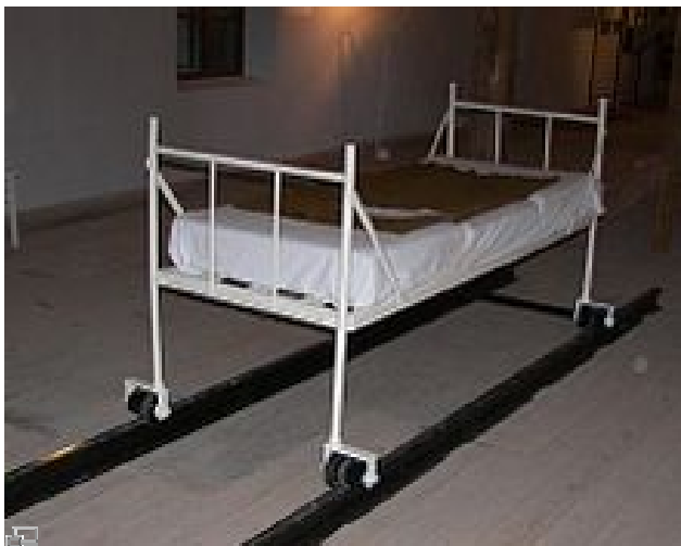
Cimrmanův úsporný úzkokolejný jednomístný lůžkový železniční vůz

Problém neustále tvrdého chleba zdaleka není nový. Řešil ho už Jára Cimrman a jeho příčinu spatřoval v každodenní křesťanské modlitbě Otčenáš . Křesťan v ní žádá Otce: „Chléb náš vezdejší dej nám DNES.“ Podle Cimrmana bychom se měli modlit: „Chléb náš vezdejší dej nám VČERA.“ Tím se chleba dostane do paradoxní časoprostorové smyčky, podle které jsme včera jedli chleba, který bude upečen dnes, a neměl tedy šanci ztvdnout. Podobnou časoprostorovou smyčku popsal později Julius Fučík v knize V zemi, kde včera znamená zítra .